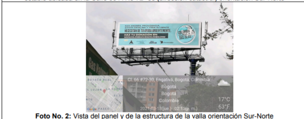
Foto No. 2: Vista del panel y de la estructura de la valla orientación Sur-Norte